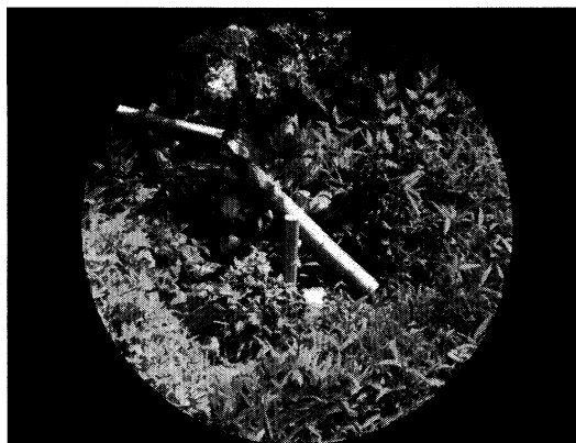
図 1 実験で用いた鹿威し画像 (視野大条件)